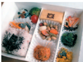
惣INOUE・日替わり弁当 880円

お弁当片手に向かうのは、散在ヶ池森林公園。鎌倉湖畔行きバスに揺られること約15分、今泉不動で降りて3分ほどで到着します。鎌倉湖とも呼ばれるこの池は、比較的静かに桜を楽しむことができる隠れたお花見の名所で