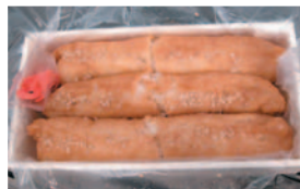
光泉・いなりずし 650円

ることが出来るので、歩き足りない方にはこちらもおすすめ。一気に歩いて、太平山の広場でのんびりお弁当を広げるのもよし。天園をはじめ十王岩や勝上けんなど絶景スポットが多々あり、賞園寺、瑞泉寺、建長寺、明月院など様々に行き先を選ぶことが出来るので、健脚な方の気ままなハイキングには最適でしょう。