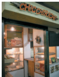
キッキリキ フォカッチャ 200円～

の丸七商店街内にひっそりとあるキッキリキで、焼きたてのフォカッチャやピザを買い込みましょう。どれも美味しいけれど、個人的におすすめなのがチーズとガーリックのフォカッチャ。もっちりとした食感にガーリックの香りがたまりません！デザート用に、大人気のラスクもお忘れなく。源氏山公園も桜の名所。降り注ぐ日射しの下、食後に寝っ転がって満開の桜を仰ぎ見て、気持ちよくうたた寝するのにぴったりの開放的な公園です。ちょっとお行儀が悪いですか？ふだん着だからこそ、のびのびと味わえる鎌倉時間。背伸びをせずにひとつ大きく伸びをして、お腹の底からリラックス！