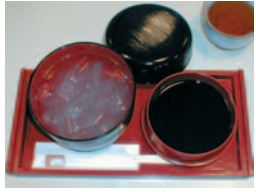
みのわ・くずきり