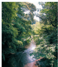
東勝寺橋からの眺め

水辺の涼しさを求めて、 東勝寺橋 付近へ。周辺の深い緑から射す不規則な木漏れ日が川面にキラキラと映り込んでまぶしい。川の流れの微妙な変化の中に、風の動きを探してみる。水の上を渡って届くひんやりとした風が頬に触れる…気持ちいい！橋のたもとから下へ降りると、 東勝寺橋ひぐらし公園 があります。公