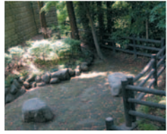
東勝寺橋ひぐらし公園

帰り道、小町通りにある 鬼頭天薫堂 へ。和の香り、心を落ち着かせ、涼しさをもたらしてくれます。夏向けの爽やかな香りでも、ご自宅でも気分良く過ごせそうですね。